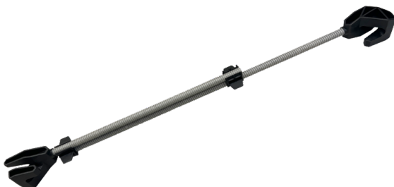
Boltstøtte / Bolt strut