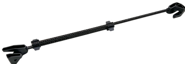
Boltstøtte / Bolt strut